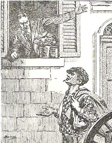
Minn Nies bla Sabar ta' Temi Zammit

2. Biex rama missier Franswà meta mar l-Argiel?