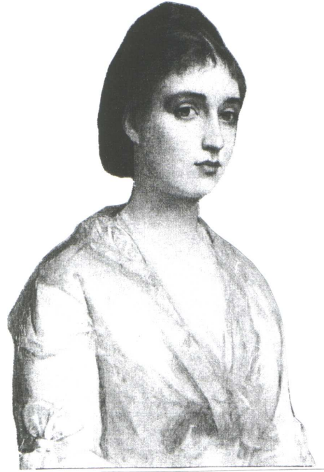
Minn pittura ta' Charles E. Halle`

id-dija u d-dawl tal-parilja, il-ħsejjes taż-żwiemel għaddejja, u ġemgħa bil-ħrara ma' biebna biex tara sbuħitna, mħabbitna: u xita ta' ross li niżlet għal fuqna bla hoss; imb'għad ix-xampanja li tfawwar bil-qawwa, bir-ragħwa, u l-kejk qisu torri bajdan, u l-foxtrot, u t-tango, u l-waltzer, u s-sakra u ż-żifna tal-qraba u l-ħbieb; u mb'għad qajla qajla ftit ftit qabdu l-bieb, u bqajna ġo darna fid-dawl tal-Madonna weħidna flimkien jien u int u int u jien; u jien kollni tiegħek, u int kollok tiegħi, bħal Eva u Adam: qalb waħda, nifs wieħed, int rieqda, jien rieqed, u l-ħolma ta' hena, ta' ferħ, ta' tgawdija, ta' dawl u ta' dija, ta' ġid u ta' sliem bla tmiem!