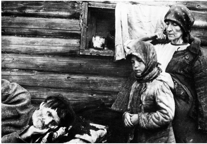
Luchd-tuatha Ruiseanach a' fannachadh leis an acras

6. Carson a tha Stòr F feumail mar fhianais mu chùisean san Ruis aig àm a' Chogaidh Chatharra?