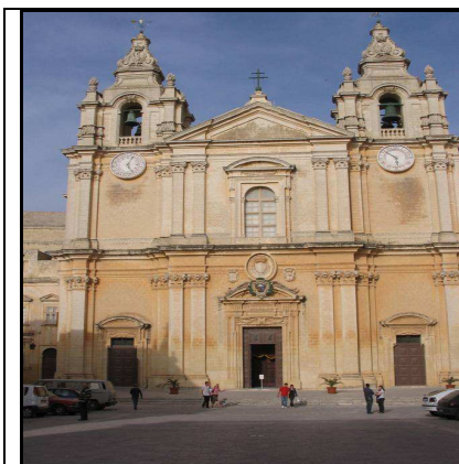
Il-Katidral ta' San Pawl