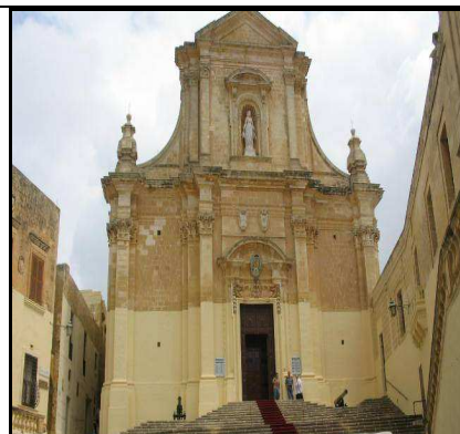
Il-Katidral ta' Santa Marija