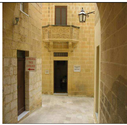
Triq dejqa f'belt go Ghawdex