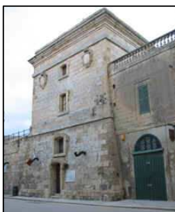
It-Torri ta' l-Istandard

Ċ (iii) Aghżel il-belt il-qadima li fiha jinsab dan il-bini. Immarka (✓) l-kolonna t-tajba. Ara l-eżempju.