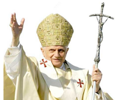
Il-Papa Benedittu XVI