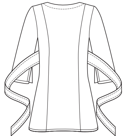
View D back view