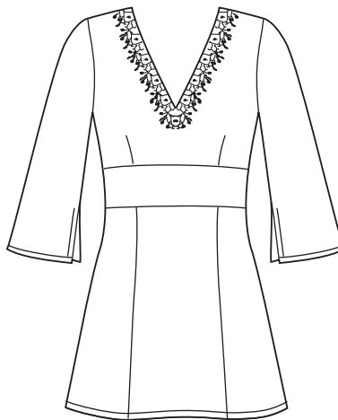
View D front view