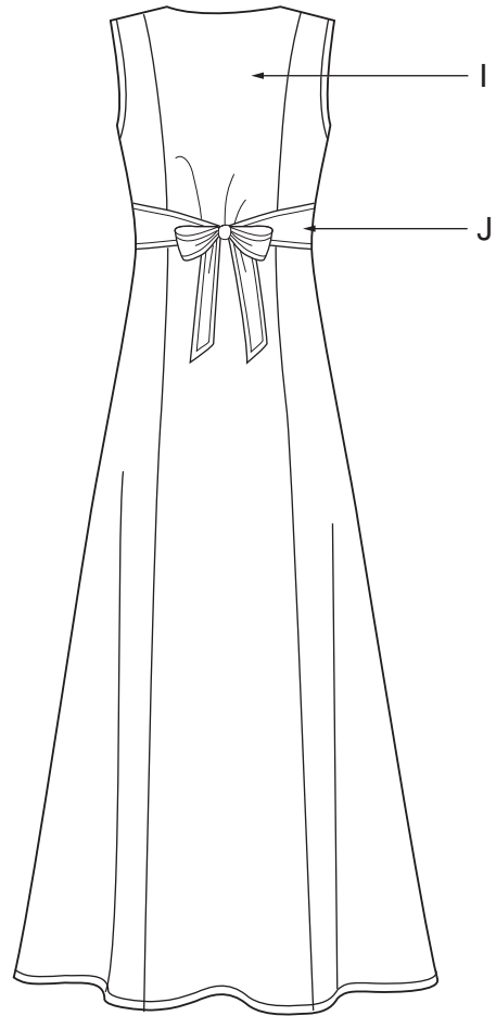
View A back view