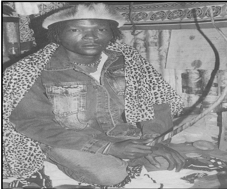
[Xi huma eka Daily Sun ya siku ra 12-12-2006]