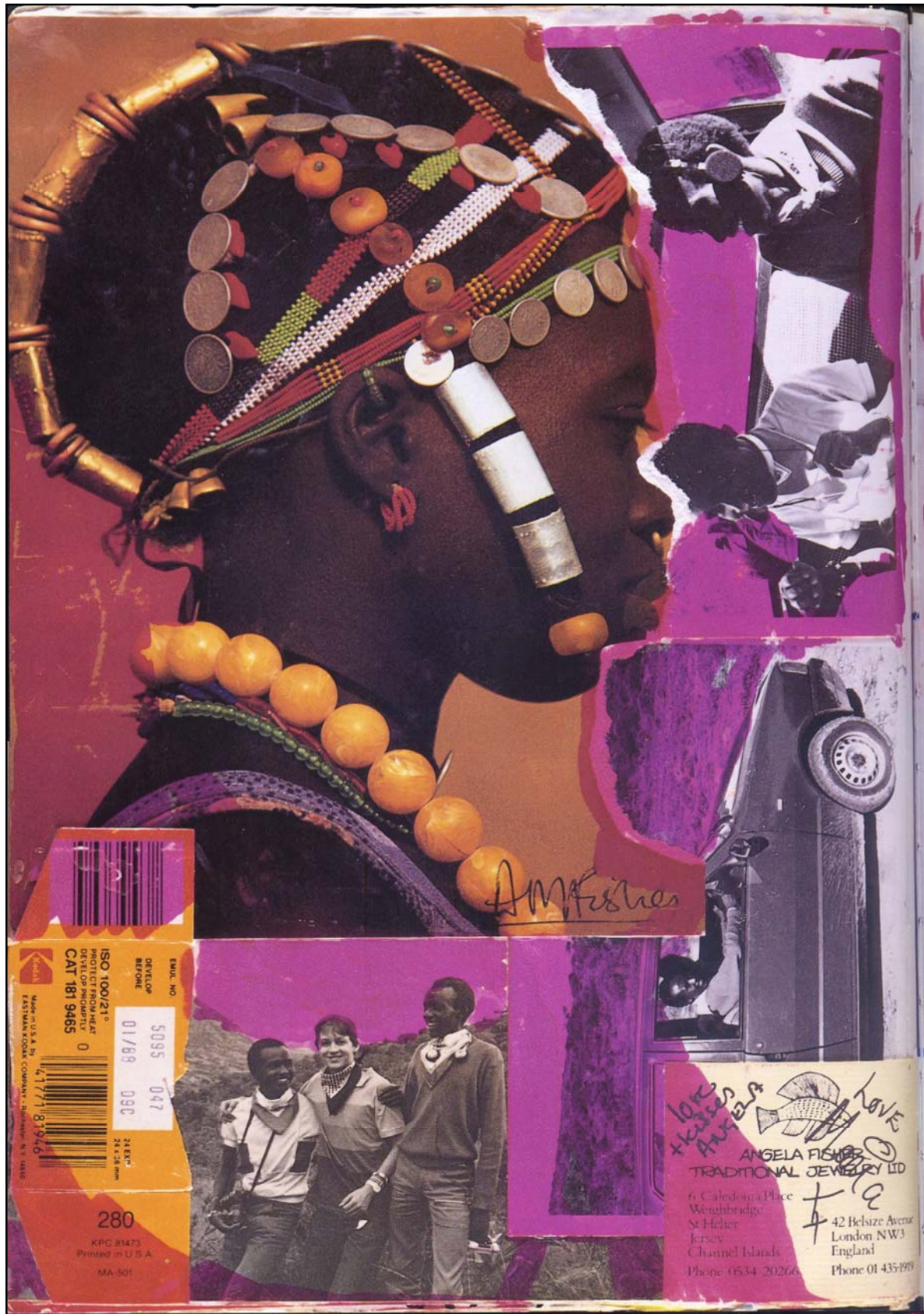
Die reis is die bestemming.