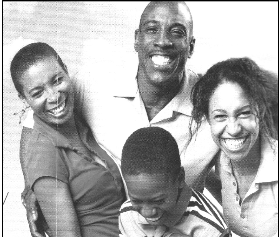
[Steshwantho sena se qotsitswe makasineng wa Indwe wa Pudungwana]