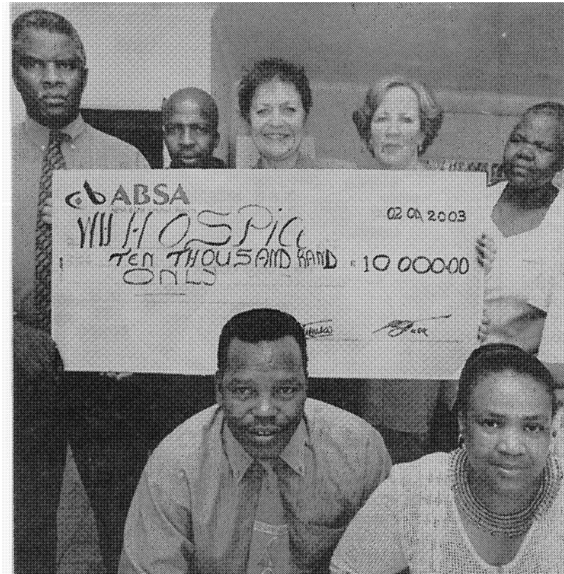
Basebetsi ba Hospice mmoho le lekgotla la lpelegeng ba ketekela mpho (Daily Sun 02 April 2003)