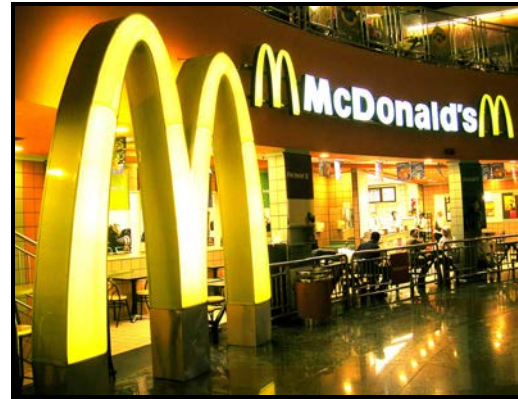
FIGUUR D: McDonald's (Bloemfontein), 2010.