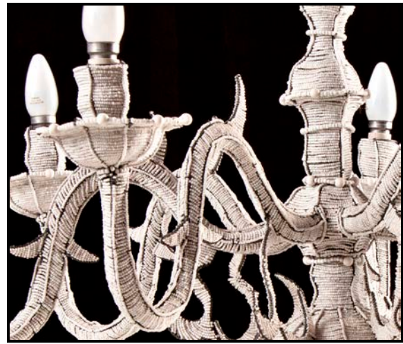
FIGUUR A: Kroonkandelaar deur Michael Chandler (Kaapstad), 2012.