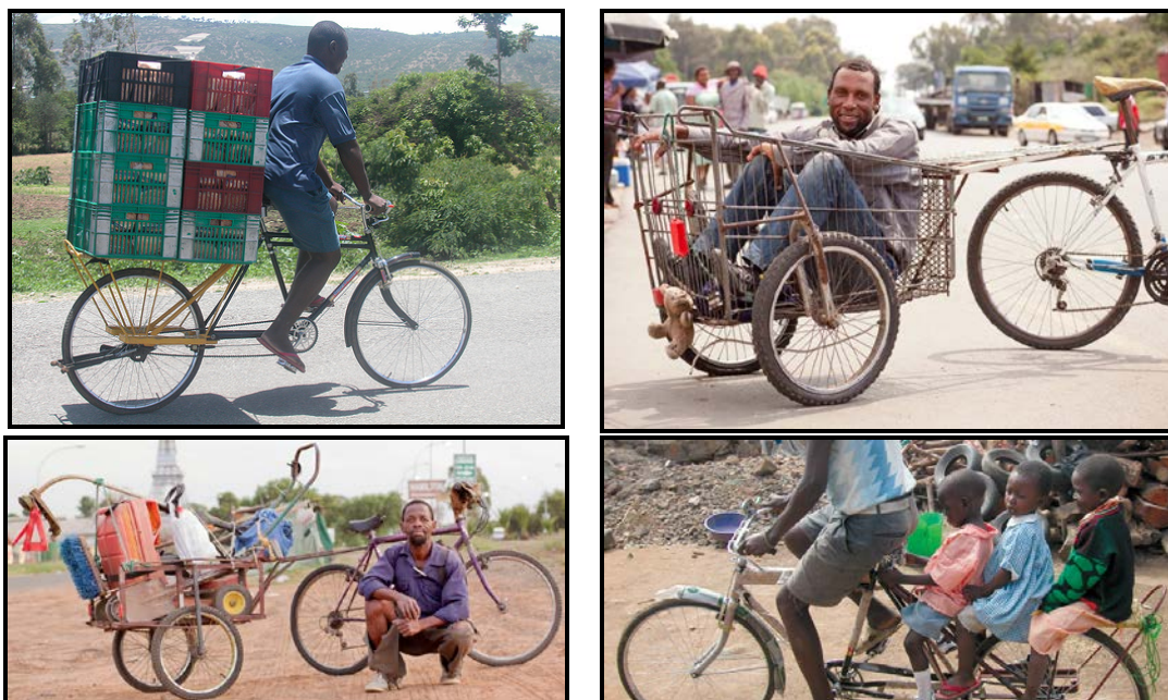
FIGUUR B: Voorbeelde van die projek se gebruike.

Die Departement van Vervoer het 'n strategie ontwikkel vir die implementering van fietse sodat landsburgers aktief betrokke kan raak by die sosiale en ekonomiese lewe in Suid-Afrika.