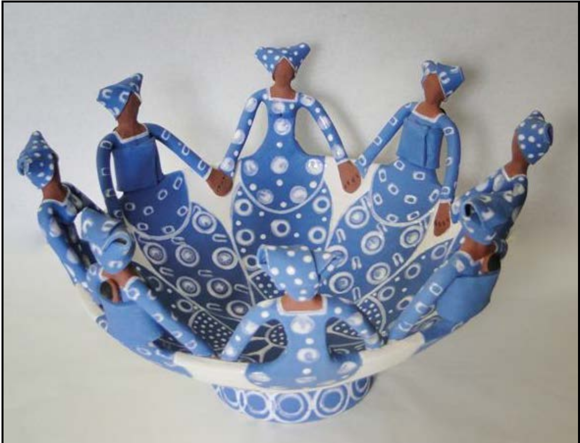
FIGUUR A: Bambani ('om vas te hou') deur die Zizamele Keramiegroep, (Kommetjie, Noordhoek, Kaapstad), 2011.

Bespreek die gebruik van die volgende ontwerpelemente en -beginsels met betrekking tot FIGUUR A: