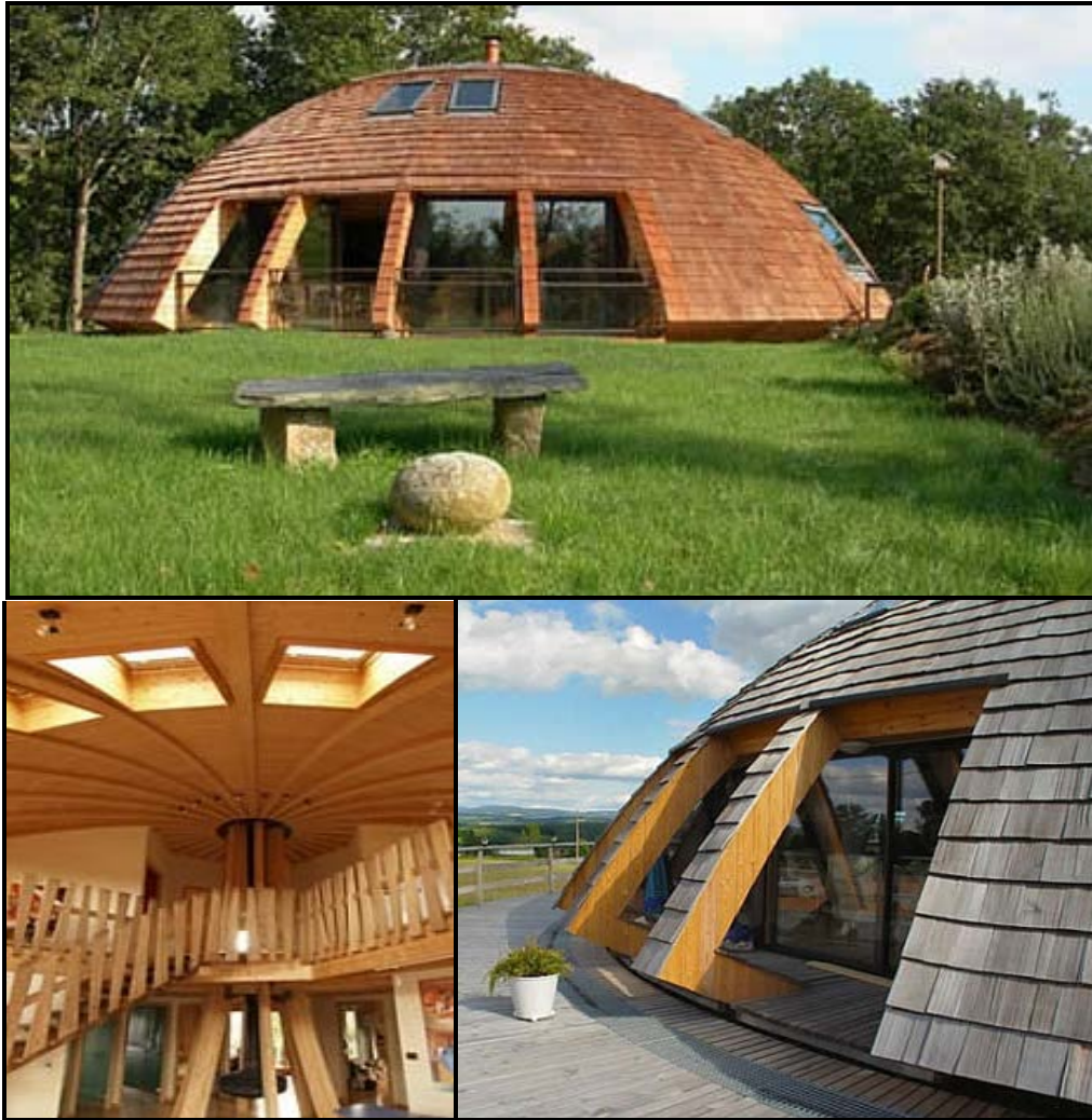
FIGUUR B: Solaleya Huis deur David Fanchon (Fort Lauderdale, VSA), 1994.

Die huis hierbo is op 'n voetstuk van beton gebou wat dit in staat stel om 360 grade in die rondte te draai.