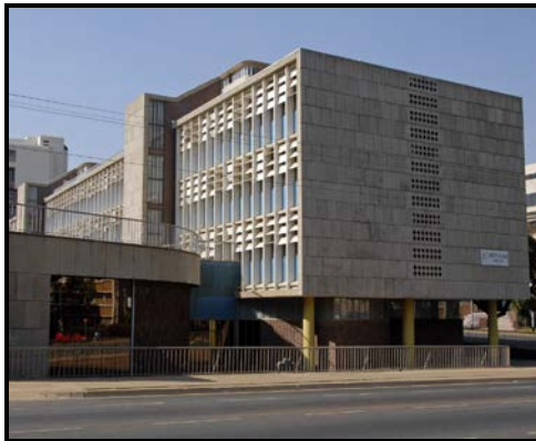
FIGUUR C: Die Vleisraad , Helmut Stauch en vennote (Pretoria), 1957.