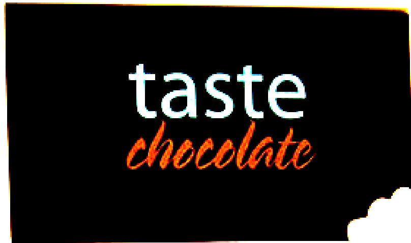
FIGUUR C: Voorkant