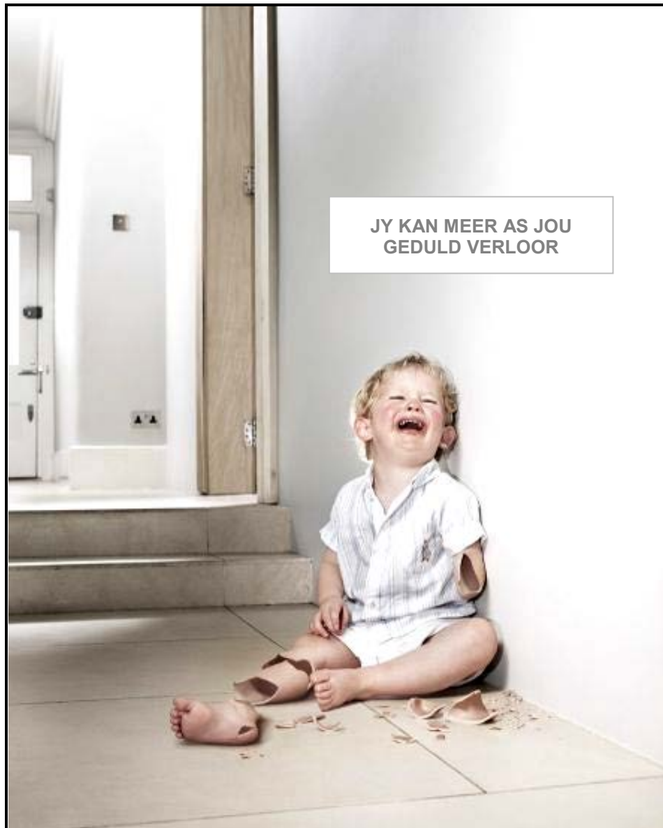
FIGUUR A: Goeie-ouer-veldtog (DDB, Pole), 2009.