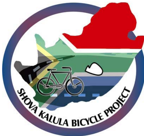
FIGUUR A: Die Shova Kalula Fietsprojek (Suid-Afrika), 2001 tot die hede.

Die Departement van Vervoer het 'n strategie ontwikkel vir die implementering van fietse sodat landsburgers aktief betrokke kan raak by die sosiale en ekonomiese lewe in Suid-Afrika.