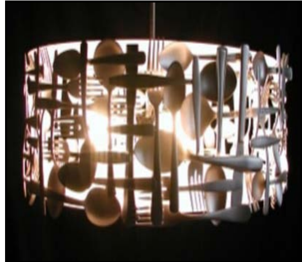
FIGUUR D: Kombuisversameling Lampskerm deur Francois Legault (Kanada), 2008.