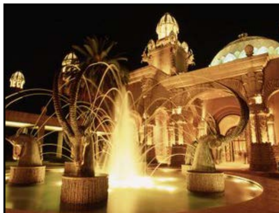
FIGUUR E: Palace Hotel, Sun City , Suid-Afrika, 1979.

Suid-Afrikaanse ontwerpe toon dikwels in die verlede en die hede invloede van die Westerse ontwerpgeskiedenis, soos gesien in die ontwerpe hierbo.