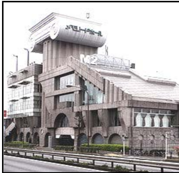
FIGUUR B: M2 Gebou ontwerp deur Kengo Kuma (Tokio, Japan), 1991.

1.2.1 Definieer die volgende konsepte met verwysing na die gebou in FIGUUR B: