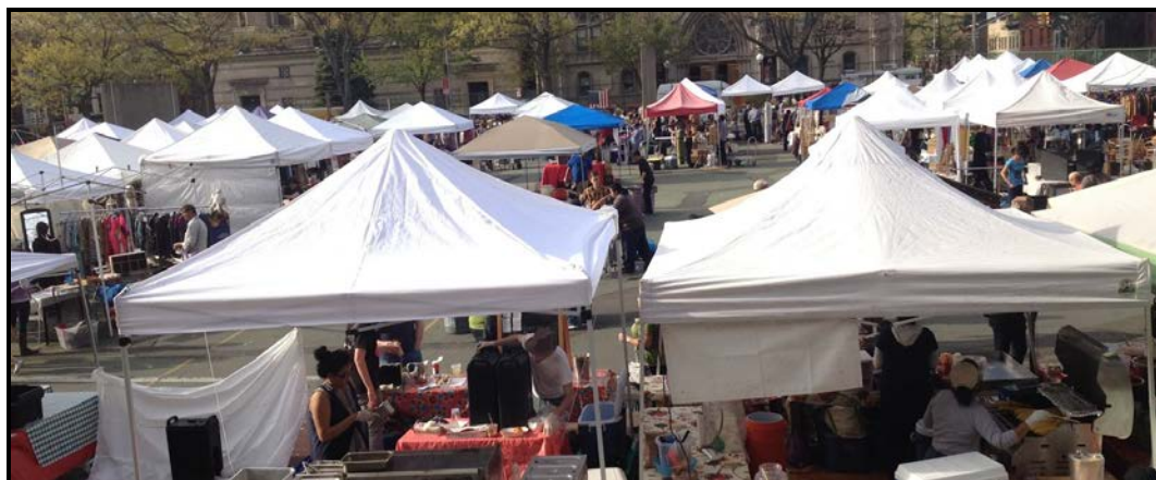
FIGUUR E: Vlooiemark (deur die gemeenskap georganiseer)