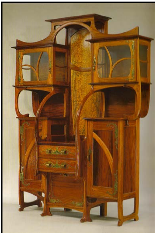
FIGUUR F: Vertoonkas deur Gustav Serrurier-Bovy, Art Nouveau, circa 1880–1905.