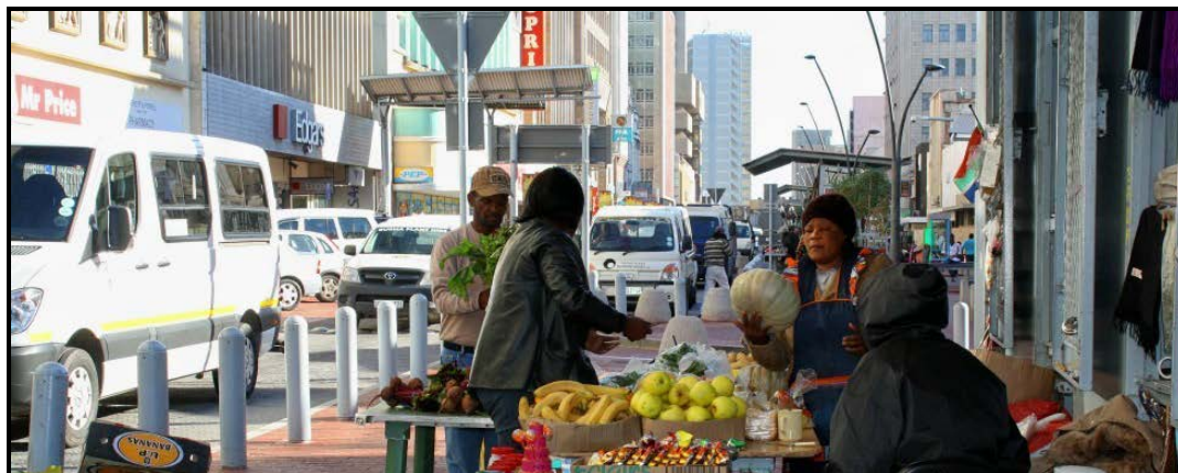
FIGUUR D: Straatmark