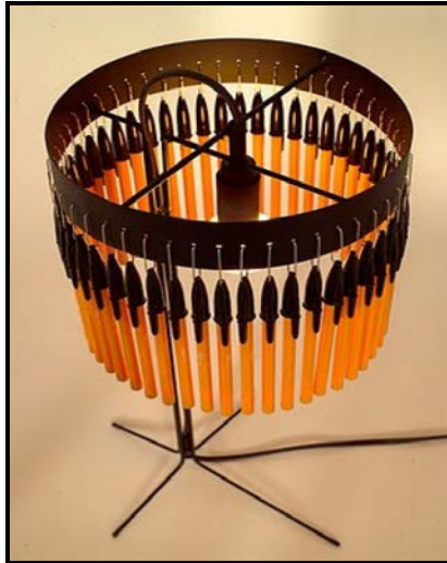
FIGUUR C: Volivik Lampskerm deur EnPieza Studios (Madrid, Spanje), 2007.