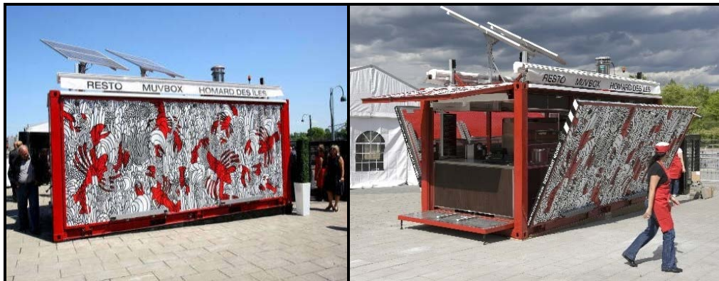
FIGUUR B: Muvbox is 'n 'Popup Restaurant' (Opslaanrestaurant) deur Daniel Noiseux (Montreal, Kanada), 2009. Peet Pienaar, medestigter van 'Popup Restaurants', sê dat 'Popup Restaurants' 'n reusetendens in die kontemporêre samelewing geword het.