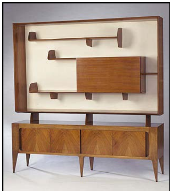
FIGUUR G: Vertoonkas deur Gio Ponti, Modernisme, 1950's.

4.2.1 Watter vertoonkas (FIGUUR F of FIGUUR G) verkies jy? Motiveer jou antwoord.