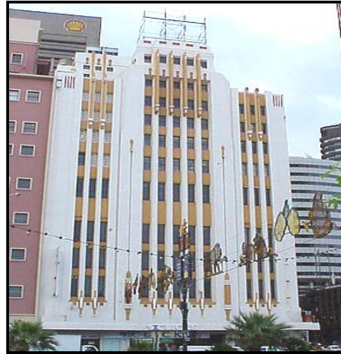
FIGUUR B: Die Kolosseum Gebou , WH Grant (Kaapstad), 1936–1938.