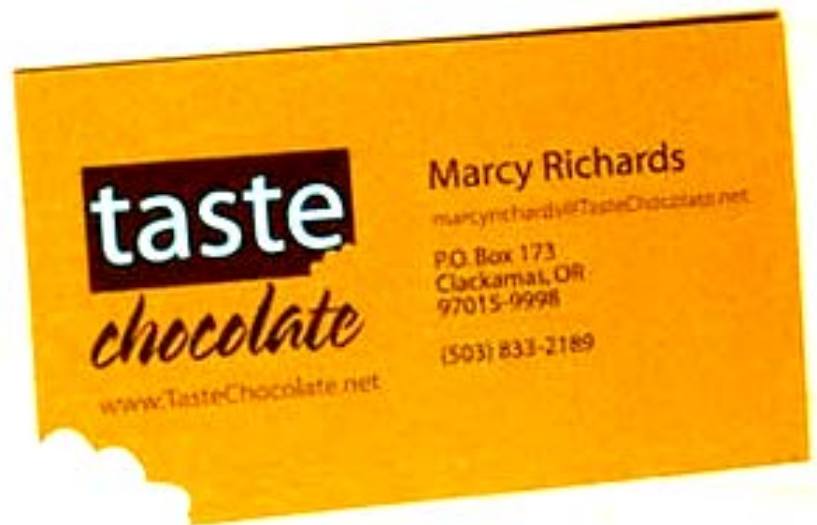
FIGUUR C: Agterkant

Beide kante van 'n besigheidskaartjie is belangrik vir die bemarking van 'n besigheid.