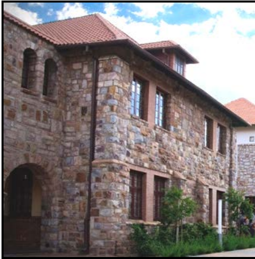
FIGUUR A: St. John's Kollege , Herbert Baker (Johannesburg), 1912.