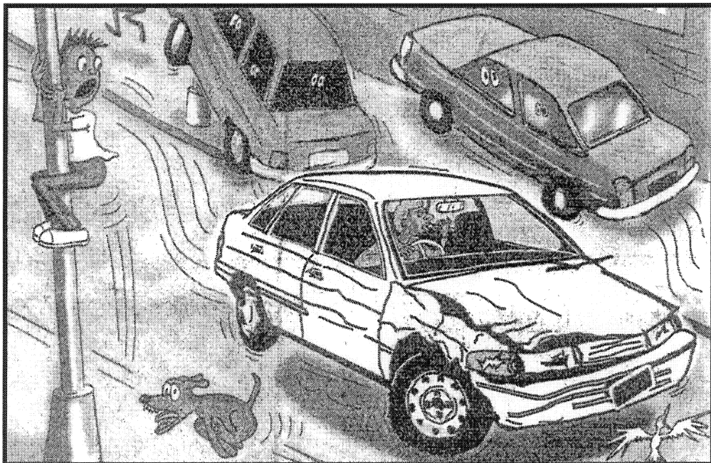
(Uit: The Star , 22 Februarie 2005)