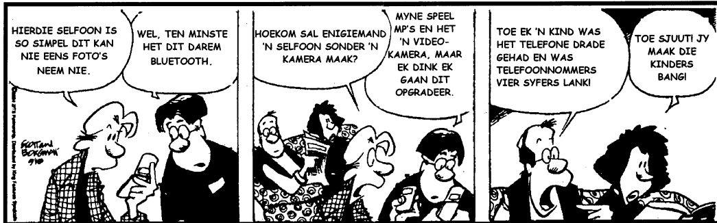
(Uit: Beeld, 25 Februarie 2005)