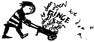
(Uit: Kwinksinnig, Grobler en De Vos)

Handwritten Afrikaans text featuring the words 'dinge', 'doen', and 'dinge te doen' repeated in various permutations and combinations. The text is densely packed and includes some larger, bolded words like 'DINGE' and 'DOEN'. There are also small annotations and symbols scattered throughout the writing.