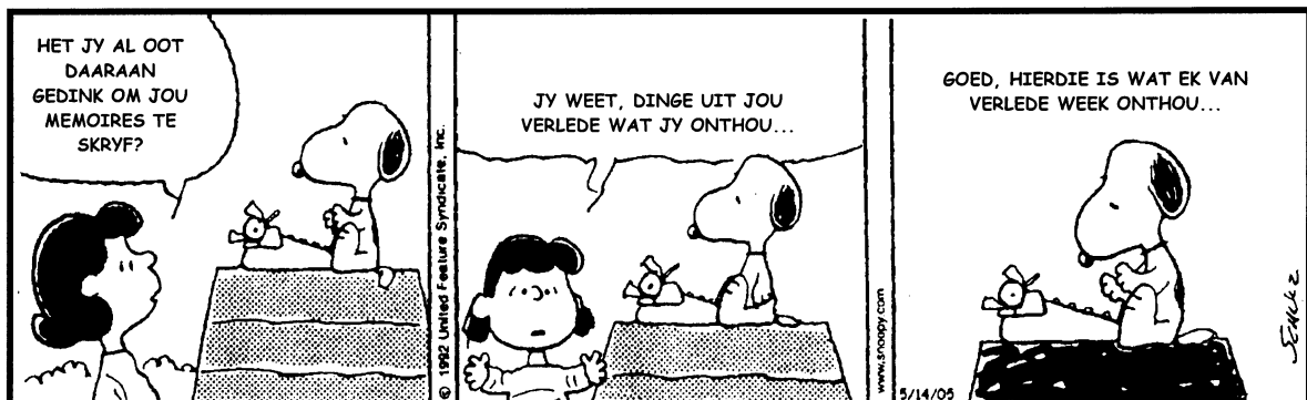
(Uit: Beeld, 2 Maart 2005)

Skryf jou memoires oor jou hoërskoolloopbaan. (40)