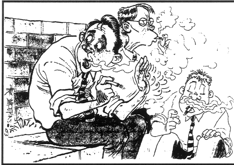
(Uit: Tydskrif-Rapport 17 Mei 2003)