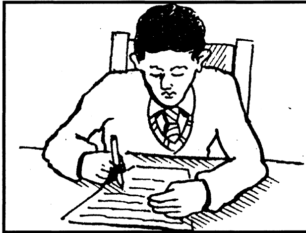
[Uit: Understanding everyday Xhosa ; Pam Wilken]

Jy is besig om die Senior Sertifikaat-eksamen te skryf. Jy leer hard daarvoor, maar jy was maar baie bang voor jy gaan skryf het.