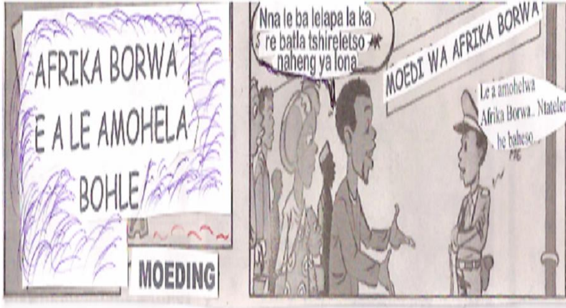
[Se nkuwe le ho lokisetwa mosebetsi ona ho tswa koranteng ya Daily Sun , ya , Labone 27 Phupu 2006].