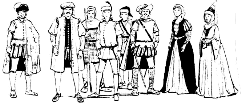
Tpingija ta' J. Mallia minn Ġrajjet Malta 2

1. Għal liema okkażjoni kienet imzejna d-dar ta' Katrin?