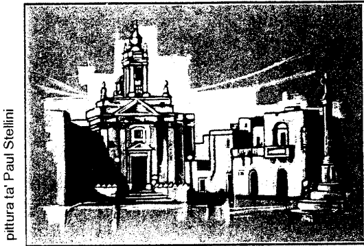
pittura ta' Paul Stellini

L-ambjent li ngħixu fih jiddetermina mhux ftit kemm ahna ngħixu hienja fil-ħajja tagħna ta' kuljum. Mingħajr ma trid, l-inhawi ta' madwarek, ftit jew wisq jaffettwaw il-burdata tiegħek għax din hija haġa psikoloġika. Darek, l-uffiċċju, il-fabbrika fejn taħdem, beltek jew raħlek, il-postijiet fejn tqatta' l-bicċa l-kbira tal-jum johlqu fik ċertu ferħ, dwejjjaq, heġġa jew bruda. (par. 1)