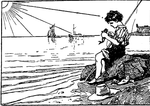
Disinn: R. Caruana Dingli

Missieri għal qalbu hawn għax iħobb jistad. Daqqa jistad bil-gobon, jinten pesta, u daqqa bil-gambli li jaqbad bil-kopp filgħodu kmieni. Il-gambli qishom tal-ħgieġ, u fl-ilma bilkemm jidhru. Dewwaqni wiehed minnhom. Kien tajjeb u ridt iżjed, imma qalli li dawk iridhom għas-sajd. (par.1)