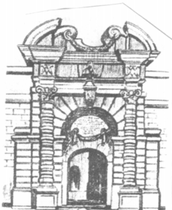
Bieb il-Forti Manwel