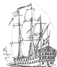
Sors B - Is-San Francesco