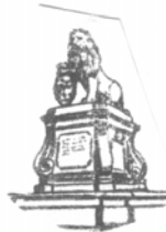
Il-Funtana ta' Il-Illjun