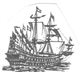
Sors A - Is-San Giovanni