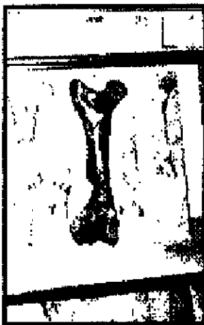
Sors 3: fossili Ghar Dalam