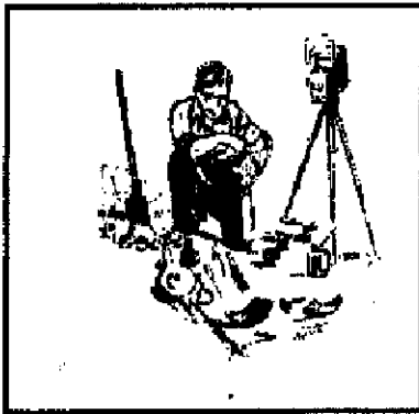
Sors 1: arkeologu