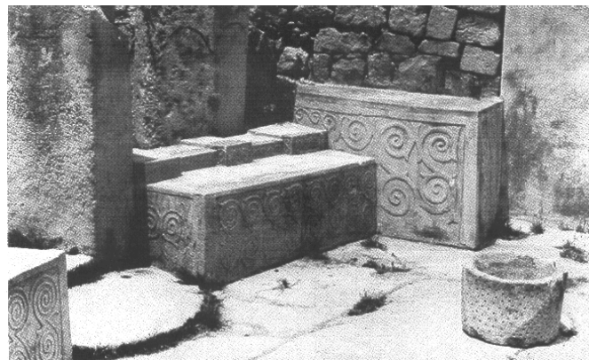
Sors 1: L-Ipoġew ta' Ħal Saflieni