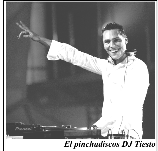
El pinchadiscos DJ Tiesto

Yo selecciono y mezclo música para el público en discotecas, bares y fiestas. Mi especialidad es el hip hop que tiene raíces afroamericanas. También me gusta reggae , hardcore y chillout . Cuando era más joven, yo era bailarina de breakdance y eso era buena preparación para la profesión de pinchadiscos. Breakdance es una danza urbana que forma parte de la cultura hip hop.