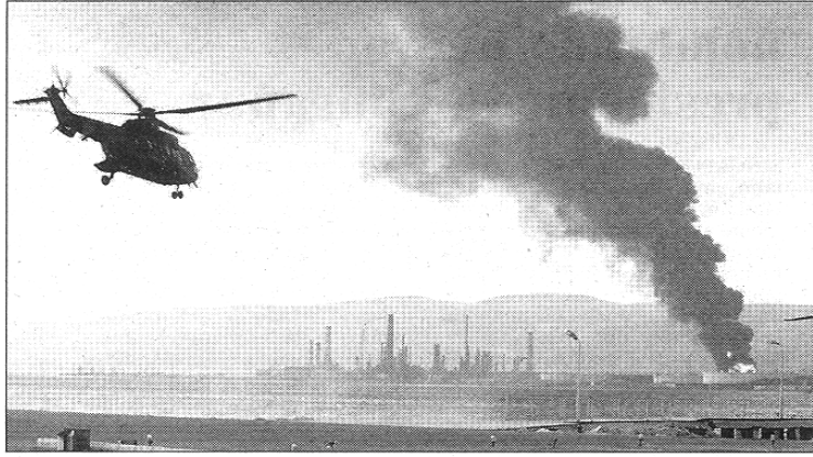
La columna de humo generada por el incendio en la refinería de petróleo de Izmit.