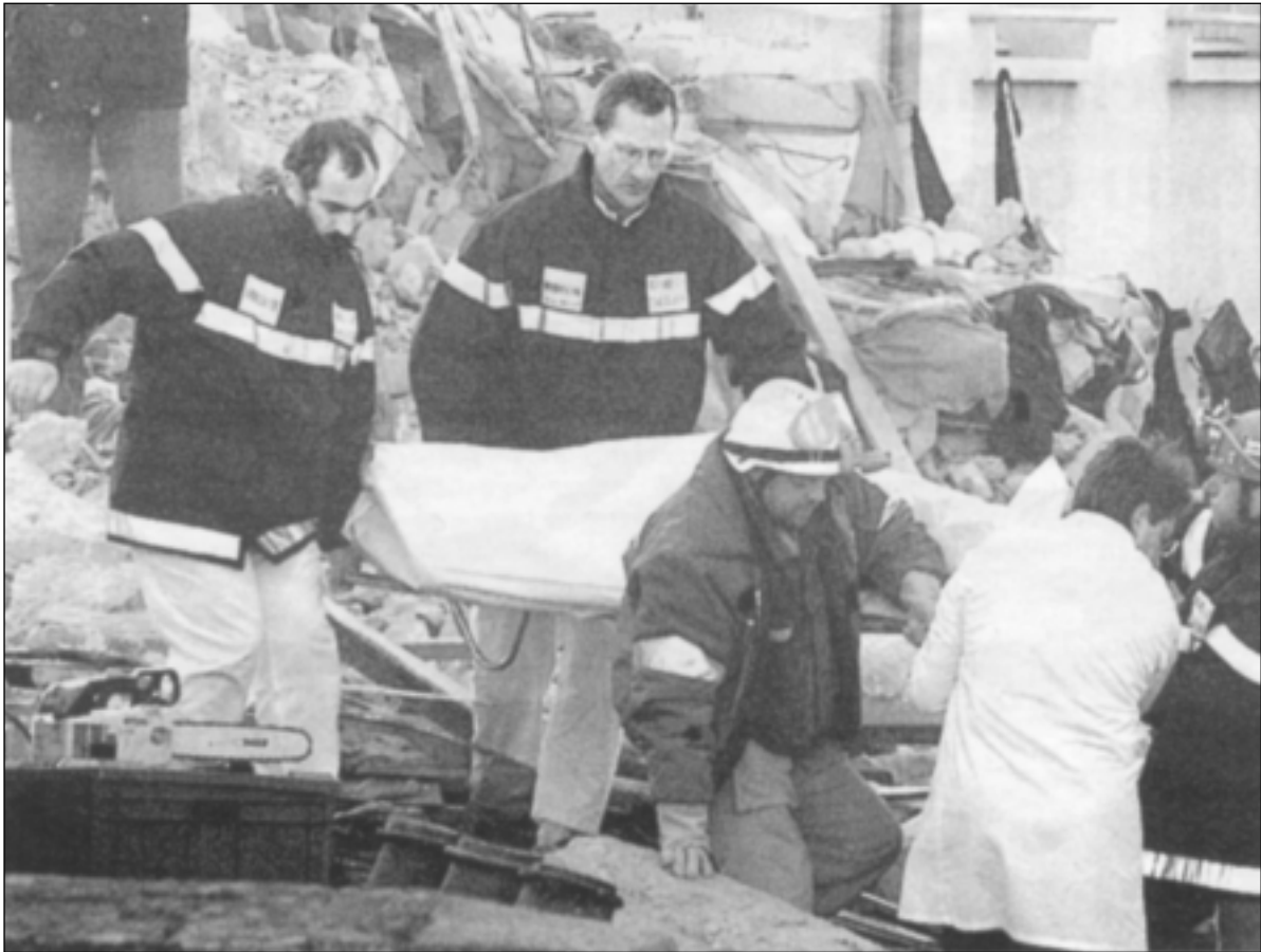
Los equipos de rescate sacan el cadáver de una persona de entre los restos del edificio siniestrado.