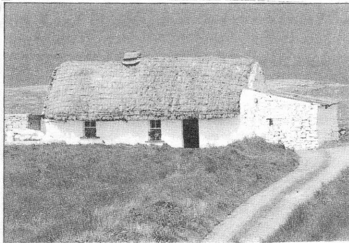
● Teachín ceann tuí in Éirinn

Chomh maith leis an rang seachtainiúil sa halla, chaith mé a lán ama sa bhaile ag iarraidh an fonn péinteála a bhí orm a shásamh. Rinne mé mo chuid oibre san áiléar i mbarr an tí. Bhí níos mó solais ann, agus ní raibh aon bhaol ann go mbeadh daoine ag lochtú mo chuid oibre. Nuair a bhaineann tú taitneamh