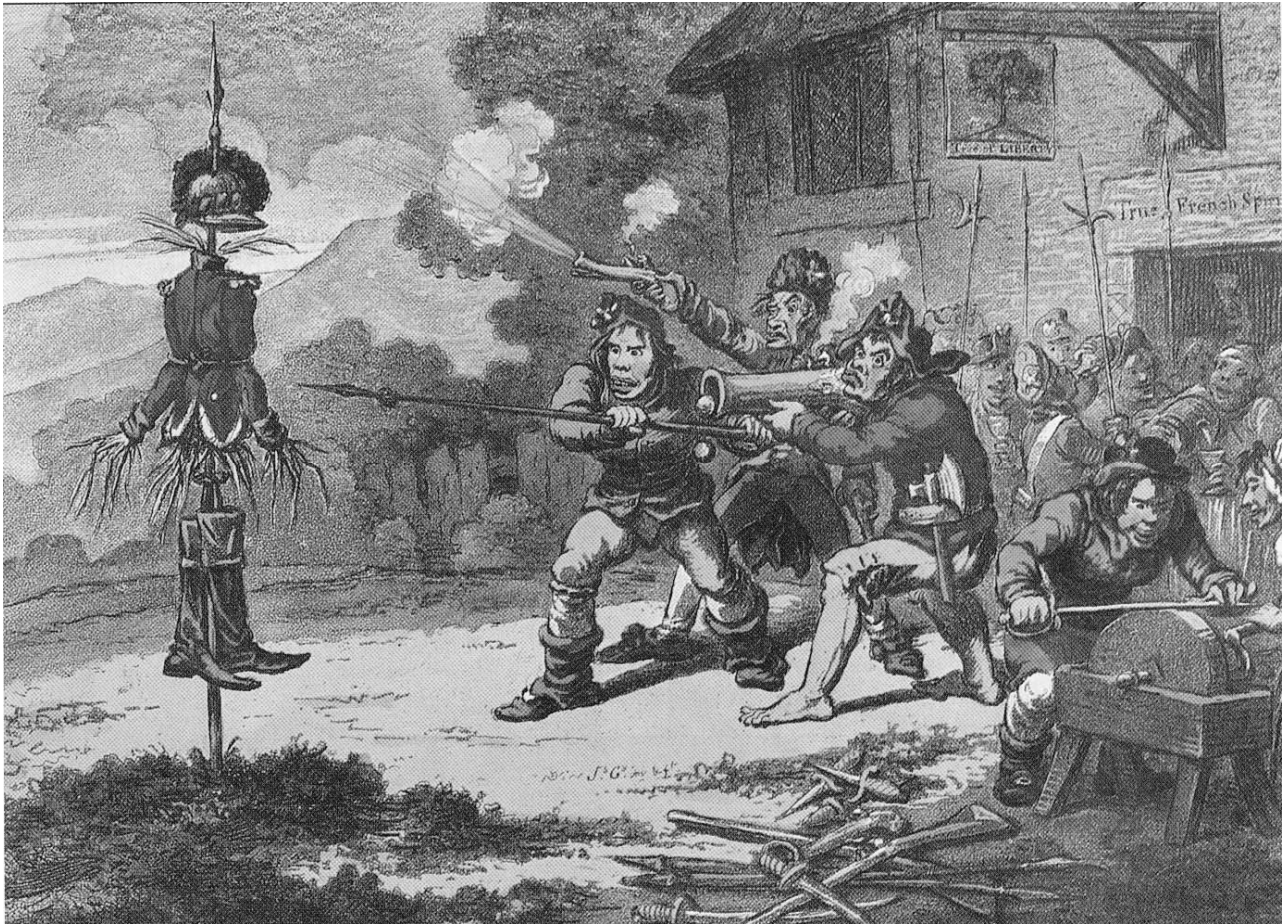
( Tógtha as Foley agus Enright, 'A Changing World' )