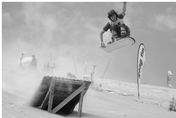
Sieht fast aus wie im Winter – nur das Element stimmt nicht ganz!

Die Sandboarding-Weltmeisterschaft in Hirschau, mitten in Deutschland, ist der jährliche Höhepunkt für Funsportler. Im Juni treffen sich dort 200 Sandboarder aus aller Welt. Auch aus Namibia, Libyen, Südamerika, Neuseeland und Brasilien gehen Enthusiasten an den Start. Gewinnen ist nicht so wichtig, aber eins wollen sie alle: Spaß haben! Und den haben sie, wenn sie auf 220 Meter langer Piste den 115 Meter hohen Quartz-Sandberg herunter carven ! Mit einem Spezial-Wachs aus Mineralwasser und Seife werden die Sandboards schnell gemacht. Bis zu 65 km pro Stunde!