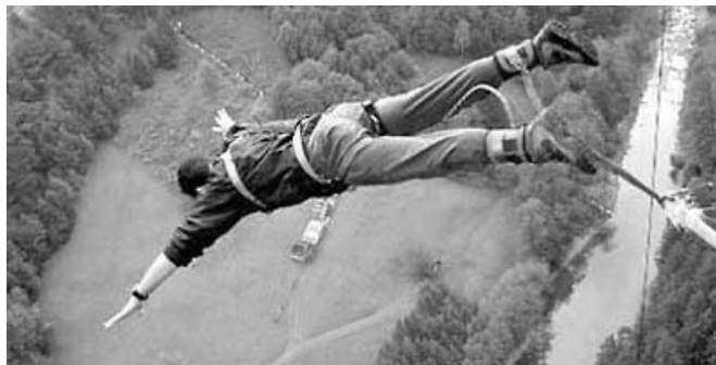
„Das ist der Waaaahnsinn!“ Der Sprung von der Europa-Brücke in Österreich.

Die Europa-Brücke ist der Treffpunkt für Adrenalin-Junkies. An Wochenenden kommen bis zu 160 Springern. Der höchste Sprung Österreichs ist die Attraktion. Selbst aus Köln, Wien und Zürich kommen die Bungee Fans – für einen spektakulären Sprung.