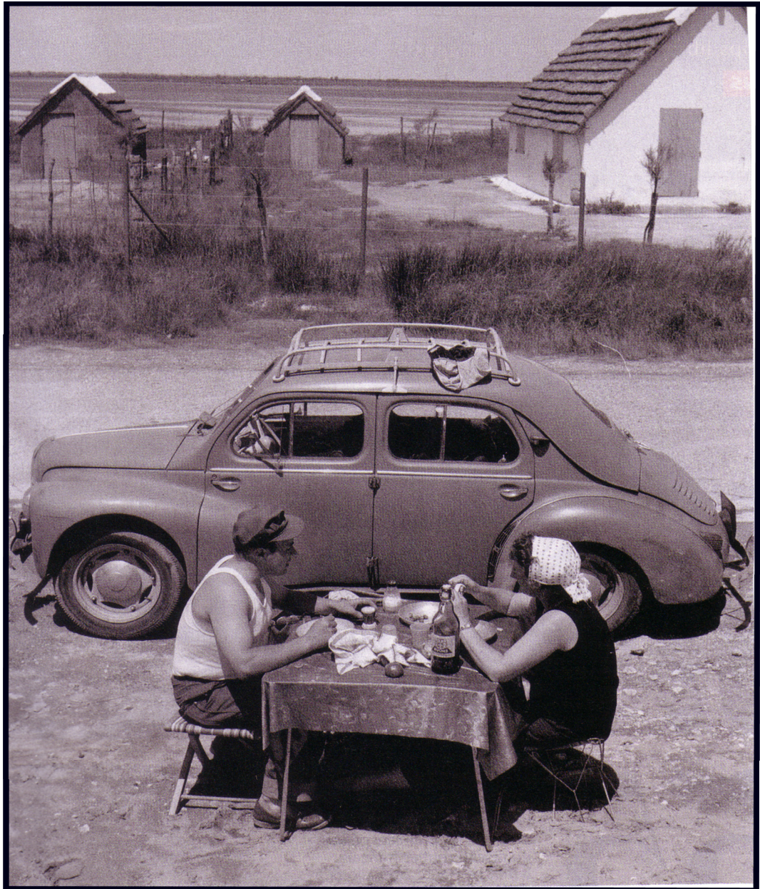
En Vacances. Été 1956.

Cinquante ans plus tard, comment les vacances ont-elles changé, et pourquoi?