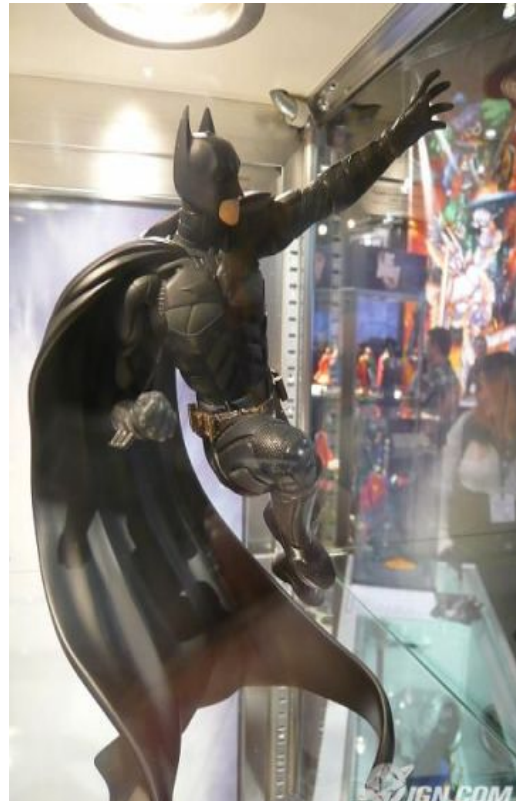
An Ridire Dorcha

4. Ceapann mórán daoine go bhfuil The Dark Knight níos fearr ná Batman Begins a bhí sna pictiúrlanna in 2005. Tugann siad 10 as 10 dó mar scannán.