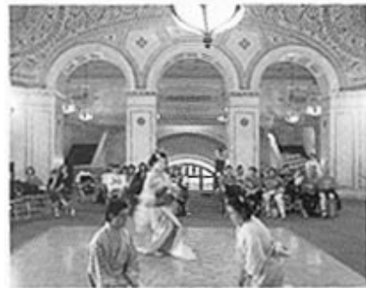
“Centro Cultural de Chicago”

El nuevo Campo de Museos que abrió al público en el mes de julio de 1998, es de aproximadamente 4 hectáreas de terreno al lado del lago y contiene un museo, un acuario y oceanario y un planetario.