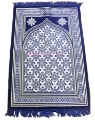
Coinneal na Cásca Mata Urnaí