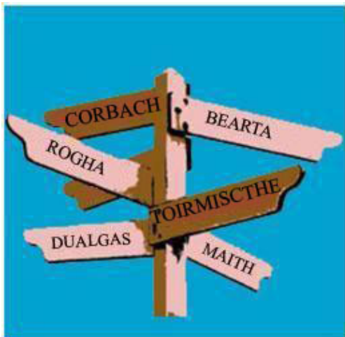
(Foinse curtha in oiriúint ó http://dailyenglish11.blogspot.ie )