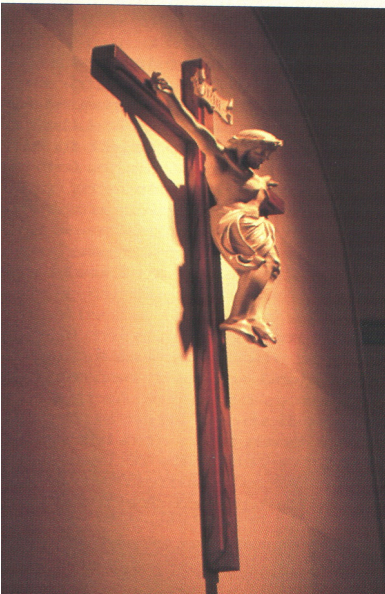
Saint Mary's Press