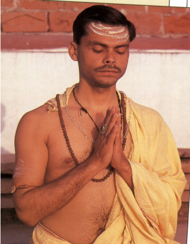
Transedition Limited agus Fernleigh Books