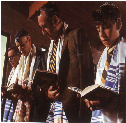
Flame Tree Publishing

A. Roghnaigh rud amháin sa ghrianghraf seo a thaispeánann go bhfuil a reiligiún á chleachtadh ag na daoine seo.