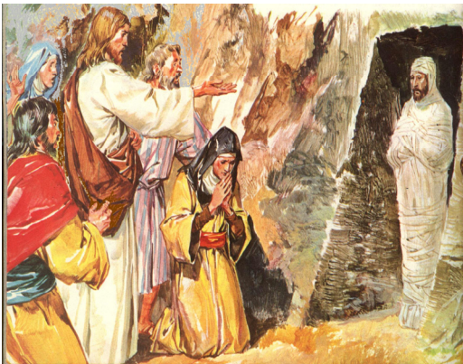
Arna oiriúint ó Octopus Books Ltd.

A. Roghnaigh rud amháin ón líníocht a thaispeánann conas mar a chuaigh míorúiltí Íosa i bhfeidhm ar dhaoine.