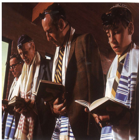
Flame Tree Publishing

A. Roghnaigh rud amháin sa ghrianghraf seo a thaispeánann go bhfuil a reiligiún á chleachtadh ag na daoine seo.