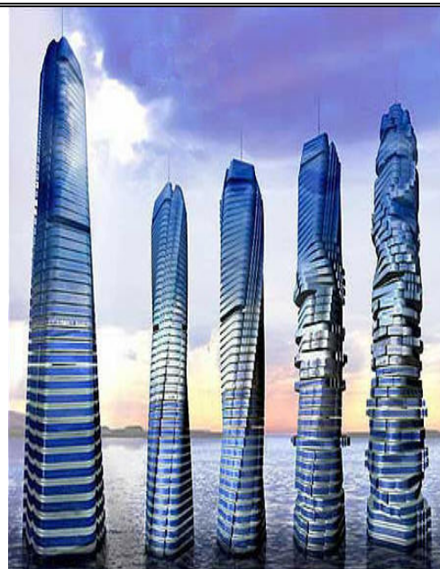
Túr ag síorathrú

Is í cumhacht na gaoithe a chasfaidh na hurláir. Beidh gineadóir gaoithe ag soláthar na cumhachta ar gach urlár. Ní dhéanfaidh an foirgneamh seo aon damáiste don timpeallacht. Cuirfidh an ghaoth an fuinneamh ar fáil agus an fuinneamh nach mbeidh ag teastáil, stórálfar sa ghréasán náisiúnta é. Tá plananna ar bun foirgneamh ar an dóigh chéanna a thógáil i Moscó amach anseo.