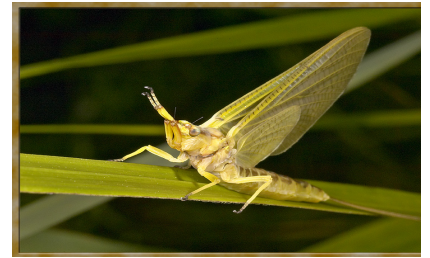
An Chuil Bhealtaine

2. An lá dár gcionn bhí sé fós faoi scamall bróin. Smaoinigh sé ar phlean. “Má shiúlaim níos tapúla, má labhraím níos tapúla, má ithim agus má ólaim níos tapúla, b’fhéidir go n-imeoidh an bhliain níos tapúla,” ar seisean. D’ith sé a bhriceasta an-tapa ar fad. D’ól sé gloine bhainne in aon slog amháin. “Tóg go bog é,” arsa a Mhamáí leis. Amach leis. Shiúil sé an-tapa ar scoil. Bhí sé ann ar fiche tar éis a hocht. Ní raibh aon duine ann. Chiceáil sé carn duilleog. D’fhéach sé suas síos. Ní raibh aon duine ag teacht. Sa deireadh chuala sé carr á pháirceáil i gclós na scoile.