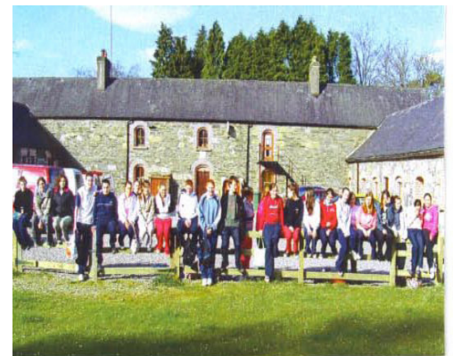
Cruinniú na nÓg – Fóram Oscailte

Más maith leat freastal ar ‘ Cruinniú na nÓg ’, is féidir foirmeacha iarratais a lorg ó oifigí Feachtas nó ón suíomh gréasáin ag www.feachtas.ie . Bíonn éileamh mór ar na ticéid. Dá bhrí sin tugtar tús áite do bhaill de ghasraí Feachtas nó d’aon dalta a fhreastalaíonn ar aon cheann de na himeachtaí a eagraíonn Feachtas i rith na bliana.