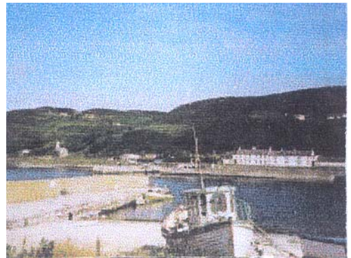
Radharc de chuid Reachlainn

Nuair a bhíonn an taoide amuigh ligeann na róin a scíth ar na carraigeacha ach caithfear fanacht amach uathu, nó imíonn siad leo isteach san fharraige.