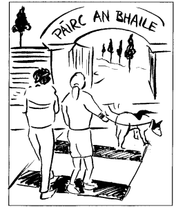
4. Ag siúl leis an madra go dtí an pháirc

Tá tusa agus do dheartháir Beirtí sna pictiúir thuas. Beidh do Mhamaí ar ais ag 8.00 p.m. Fág NÓTA do do Mhamaí. (Bróna is ainm duit féin.)