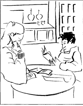
1. Obair bhaile