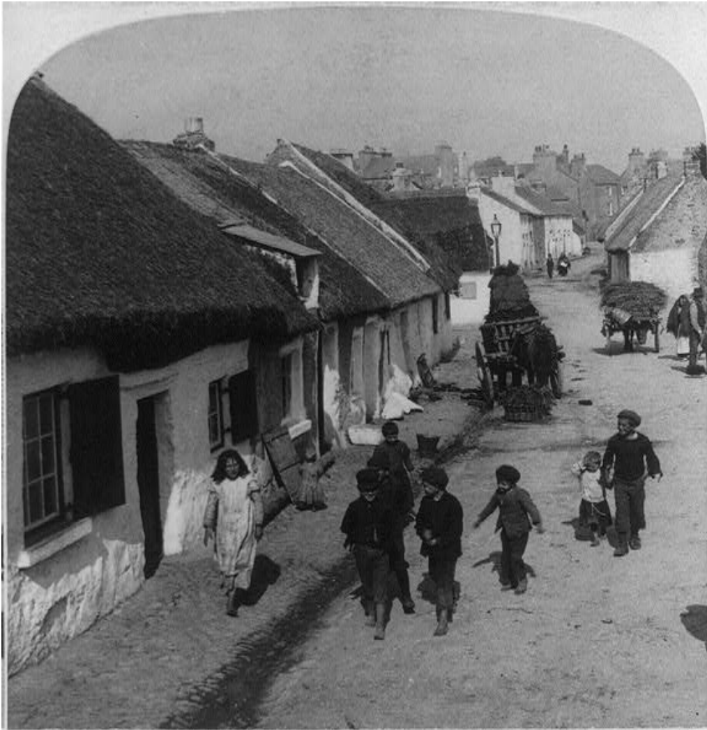
In Claddagh—where old Irish Customs and Language survive—suburb of Galway, Ireland, Copyright 1901 by Underwood & Underwood.

Sa Chladach – áit a maireann nósanna agus teanga na nGael – bruachbhaile de chuid na Gaillimhe, Éire. Cóipcheart 1901 ag Underwood & Underwood.