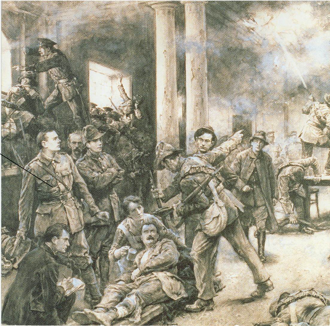
(Foinse: 'Birth of the Republic' le Walter Paget. Ard-Mhúsaem na hÉireann.)