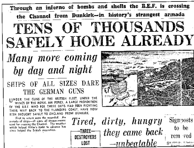
Daily Express, May 31, 1940

Léigh an t-alt nuachtáin thíos agus ansin freagair na ceisteanna a leanas.