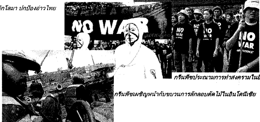
กรีนพีซประณามการทำสงครามในอิรัก