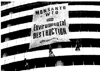
กรีนพีซแขวนป้ายประท้วง มอนซานโต ทำให้เกิดการปนเปื้อนพันธุกรรม