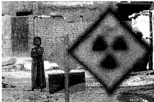
ดูเวทา ในอิรัก เยื่อสารกัมมันตรังสีจากการโจมตีของสหรัฐฯ