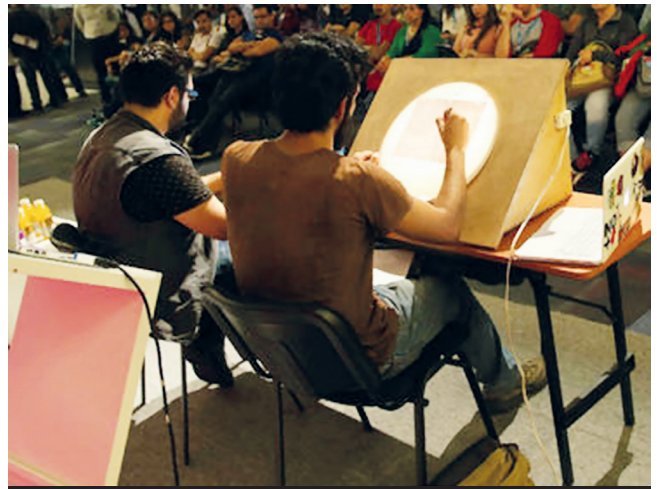
Buscan consolidar 33 mil empleos en ramas como post producción, animación, multimedia, VFX* y videojuegos.

30 En Jalisco, tras analizar esta problemática, se constituyó, sin ánimos de lucro, la Asociación Jalisciense de Industrias Creativas el 28 de abril de 2015, para promover iniciativas privadas y públicas con programas de capacitación, adopción de modelos de calidad, competencia leal y sustentabilidad.