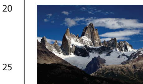
20 25

4 Traslado en autobús desde Calafate a El Chalten. Alojamiento en la Hostería El Pico, desde donde podrán ver el monte Fitz Roy. Senderismo en el monte Fitz Roy de día completo a Laguna de los Tres. A 1000 metros de altura contemplarán el monte desde una de sus mejores vistas, podrán casi tocarlo con sus manos. Podrán elegir entre hacer senderismo en el glaciar Torres o Huemul (Lago del Desierto) o conocer el hogar del que fuera el primer poblador de la zona, el danés Andreas Madsen.