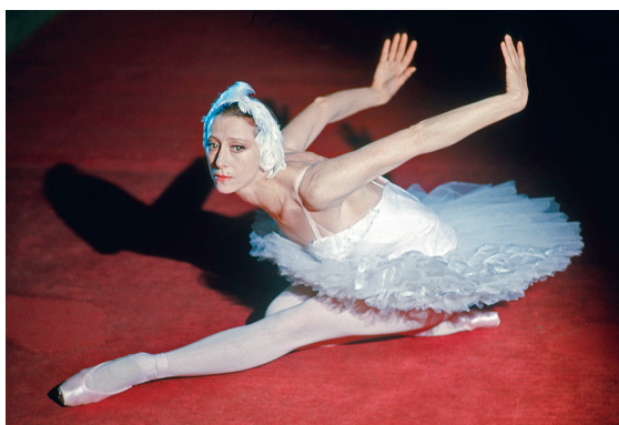
Прима-балерина Большого театра СССР с 1948 по 1990 годы

Начала с того, что наговорила на магнитофон одиннадцать кассет. Знакомый журналист стал делать из моих записей книгу. Понадобилось ему на то три месяца. Написал много, длинно, напыщенно. Нет, не моя это книга. Я отвергла ее.