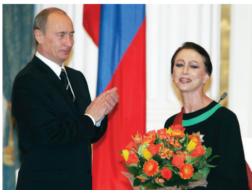
Владимир Путин и Майя Плисецкая