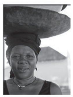
As lavadeiras, uma presença constante na paisagem são-tomense, vista geral da cidade de São Tomé e mulher que regressa do Mercado. Pescadores junto à Lagoa Azul.