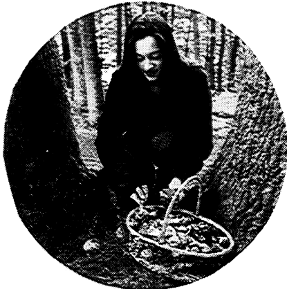
3. Bory Tucholskie