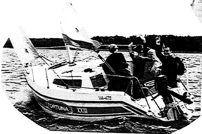
1. Na Mazurach