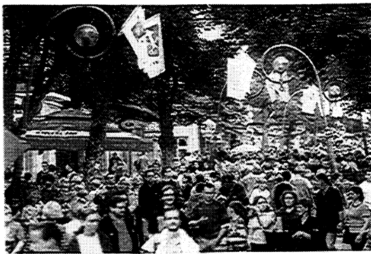
2. Zawsze modne Zakopane