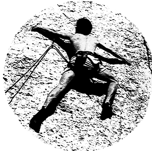
5. Jurajskie przygody